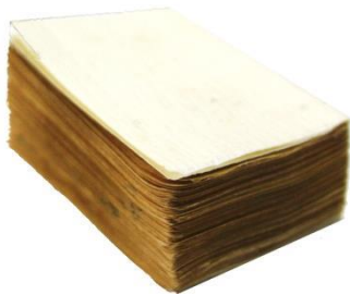
Buchblock ist „gelumbeckt“

Nach dem Trocknen bringe ich einen passenden Geweberücken an. Da durch die frühere, ständige Abnützung die alten Buchdecken etwas kleiner als der Buchblock sind, klebe ich Leinenfaserreste vom alten Geweberücken auf das Vorsatz bevor ich die alten Buchdeckel wieder aufklebe. Dadurch erhalte ich saubere Deckelkanten, einer kleinen Schere schneide ich Deckelkanten noch etwas nach.