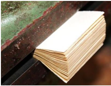
Buchblock in der „Meilerpresse“ eingespannt

Zurück zu unserem „Lilliput“, da der Buchblock für unsere Lumbeck Vorrichtung viel zu klein ist, spanne ich ihn in der „Meilerpresse“ ein, ritze seinen Buchrücken mit dem Ritzmesser etwas an, damit der Leim später besser in die Buchseiten eindringen kann. Der Buchblock wird nach beiden Seiten aufgefächert und dabei jeweils gut mit Leim eingeleimt.