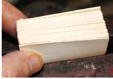
Mit Ritzmesser eingeritzt