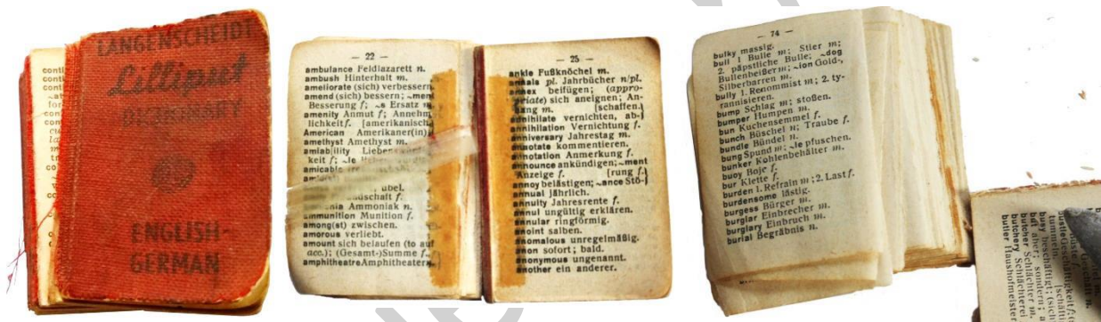
Buchblock am Rücken gebrochen

Der Buchrücken ist mehrmals auseinander gebrochen, das Rückengewebe hat sich fast aufgelöst. Der Rückentitel ist nicht mehr zu entziffern. Mit „Tesa“ versuchte man an mehreren Stellen den Buchblock wieder zusammen zu kleben. Um den Buchblock neu „Lumbecken“ zu können, muss ich vorsichtig das Büchlein, Blatt für Blatt zerlegen. Mit dem Buchbindermesser entferne ich die alten Leimreste.