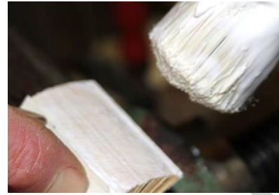
nach einer Seite aufgefächert und geleimt

Der Leim dringt durch das Auffächern gut in den Buchblock ein. Anschließend beklebe ich den Buchrücken mit Gaze. Die Heftfäden der Gaze verbinden sich gut mit Leim und Blattkanten. Der geleimte Buchblock wird auf einem Brett zum Trocknen abgelegt und kann später weiter verarbeitet werden.